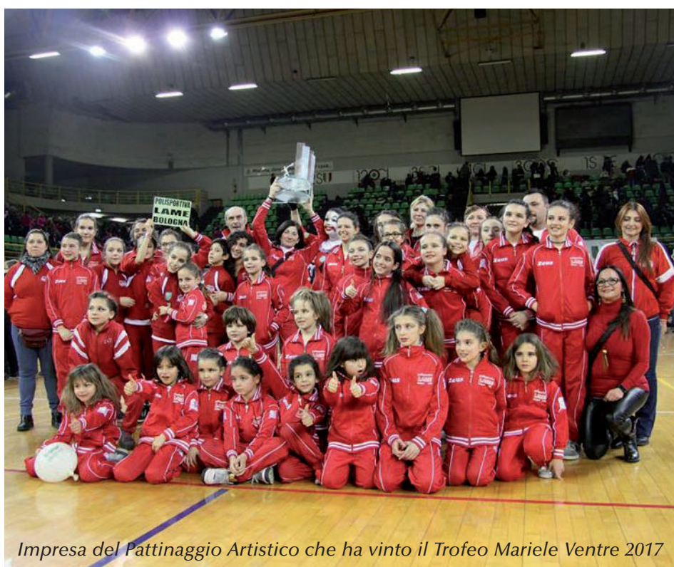
Impresa del Pattinaggio Artistico che ha vinto il Trofeo Mariele Ventre 2017